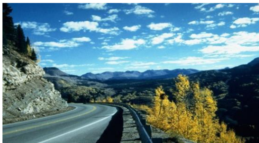
Región 5 La famosa “Autopista del millón de dólares” de Colorado Parte de San Juan Skyway US 550

Si las mejoras se consideran como bienes muebles, de conformidad con la ley estatal, el propietario inquilino podrá recibir un reembolso por trasladarlas en virtud de las disposiciones de asistencia para reubicación. El profesional de bienes raíces se comunicará personalmente con los propietarios inquilinos de las mejoras para explicarles los procedimientos a seguir. Todos los pagos deben realizarse conforme a los reglamentos federales y leyes estatales correspondientes.