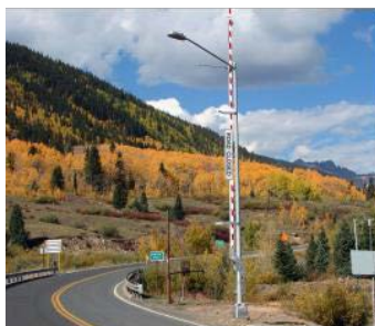
Región 5 US 550 Silverton

En ocasiones, los edificios, construcciones u otras mejoras consideradas como bienes inmuebles se encuentran en la propiedad que será adquirida. En este caso, el organismo debe ofrecer adquirir dichos edificios, construcciones u otras mejoras, si estas serán eliminadas o si el organismo decide que las mejoras se verán perjudicadas en la ejecución del proyecto o programa público. Las mejoras de bienes inmuebles son aquellas que se han fijado al terreno de forma permanente, y que si se eliminan podrían sufrir daños o podrían ocasionar daños al edificio u otra construcción al ser eliminados. Tales mejoras representan bienes inmuebles que se incluirán en la tasación.