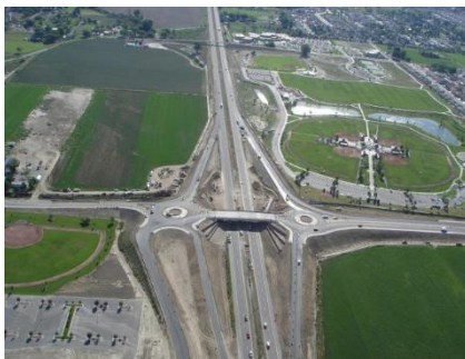
Región 3 I-70 en 24 Road Grand Junction. Puente y dos rotondas

Se le pedirá a usted o a cualquier representante que usted designe, que acompañe al tasador durante la inspección de la propiedad. Durante la inspección, el tasador también elaborará un inventario de bienes