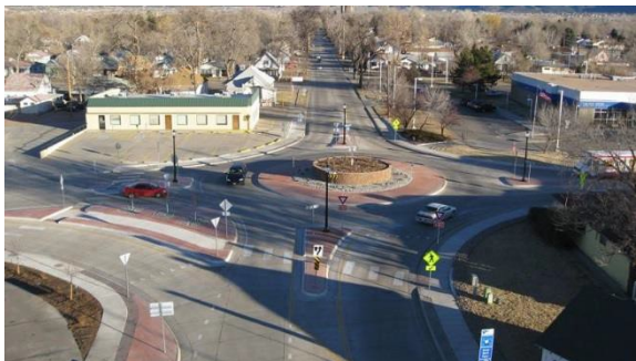
Región 2 Proyecto de rotonda en Canon City

Los resultados de estos estudios se recopilan en informes detallados que son evaluados por organismos