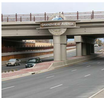
Región 1 Puente de Wadsworth y Grandview

En Colorado, usted puede escoger que una junta de comisionados o un jurado determine el monto de compensación que usted merece a cambio de la propiedad adquirida por el organismo. Estos trámites tendrán lugar en una “audiencia de valoración” (comisión) o “juicio de valoración” (jurado), y se le permitirá, tanto a usted como al organismo, presentar al tribunal información acerca del valor justo de mercado de la propiedad adquirida. La comisión o jurado establecerán la compensación justa por la adquisición, y el tribunal certificará el monto definitivo de compensación justa al finalizar la audiencia o juicio de valoración.