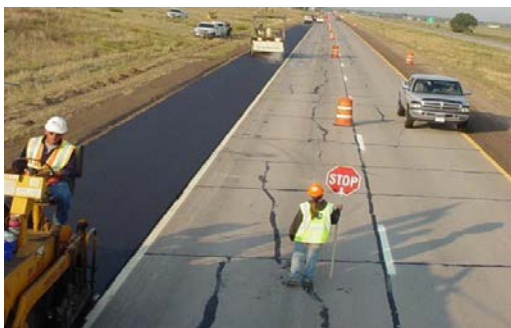
Región 4 Proyecto de revestimiento del pavimento en Fort Morgan.

También conocido como un “agente”, el profesional de bienes raíces es el miembro del personal del organismo, o contratado por esta, que le asistirá a través del proceso de adquisición y reubicación (si esto fuere necesario).